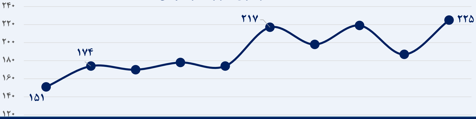
مطالبات غیر جاری (هزار میلیارد تومان)

بهار ۱۴۰۰ زمستان ۱۳۹۹ تابستان ۱۳۹۹ پاییز ۱۳۹۹ زمستان ۱۳۹۸ بهار ۱۳۹۹ تابستان ۱۳۹۸ پاییز ۱۳۹۸ زمستان ۱۳۹۷ بهار ۱۳۹۸