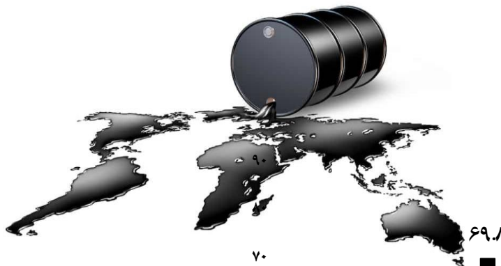
میانگین قیمت نفت خام سنگین ایران - دلار در هر بشکه