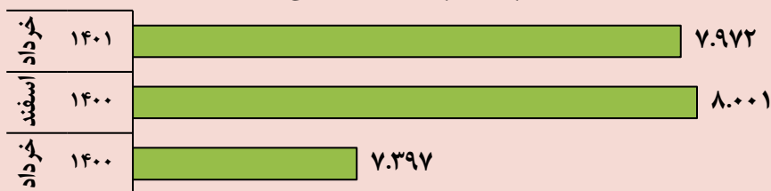
ضریب فزاینده نقدینگی